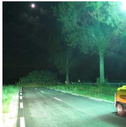
Des arbres d'une trentaine de mètres ont été abattus fin août pour libérer l'espace nécessaire aux bretelles d'autoroute.

En fonction des flux horaires de trafic sur l'A35, les travaux ont été calibrés de nuit ou en période creuse pour minimiser la gêne occasionnée aux usagers. Les fermetures de voie à la circulation seront rarement employées, sur de courtes durées, uniquement pour des opérations exceptionnelles à l'image de l'abattage d'arbres.